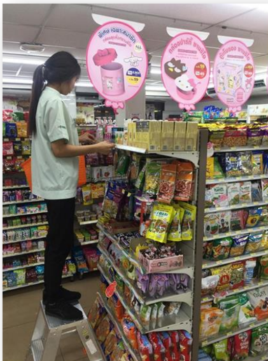
รูปภาพที่ 9 ขั้นตอนที่ 2 เตรียมสินค้าที่ลูกค้าชาวอินเดียนิยม

ขั้นตอนที่ 2 เตรียมสินค้าที่ลูกค้าชาวอินเดียนิยม เช่น น้ำมันออยล์ น้ำมันมะกอก สินค้าประเภทถั่ว ชา น้ำหอม สนิกเกอร์ และจัด Shelf สินค้าขึ้นมาหนึ่ง Shelf