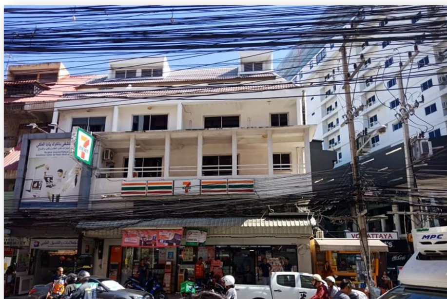
ภาพที่ 1 เซเว่น – อีเลฟเว่น (7-11) สาขาโรงแรมVC รหัส(02143)

ชื่อสถานประกอบการ เซเว่น-อีเลฟเว่น(7-11)สาขาโรงแรมVC รหัส(02143)