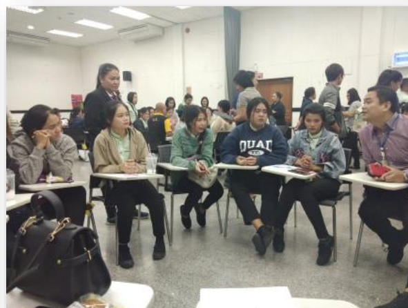
รูปภาพที่7-8 ขั้นตอนที่ 1 ประชุมและวางแผน