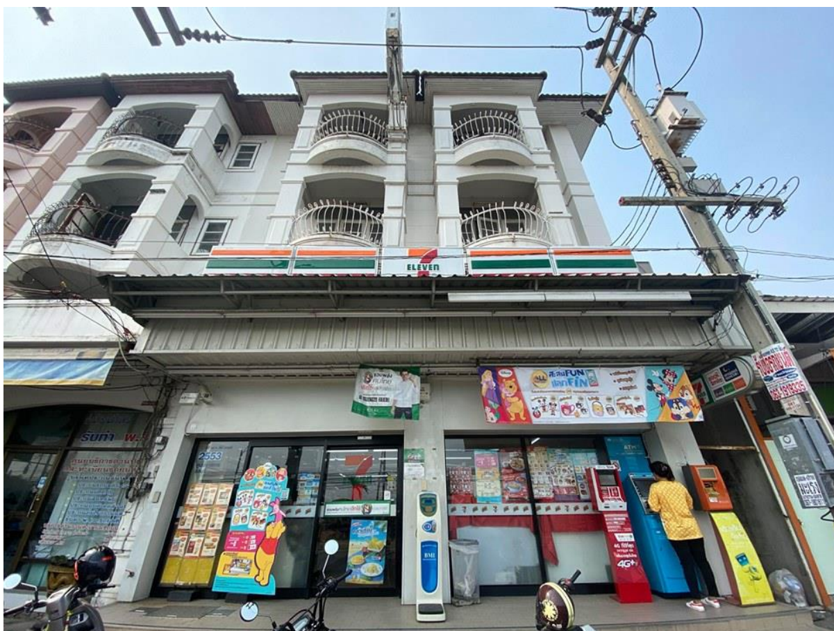
ภาพที่ 4 เซเว่นสาขาศูนย์ราชการชลบุรี