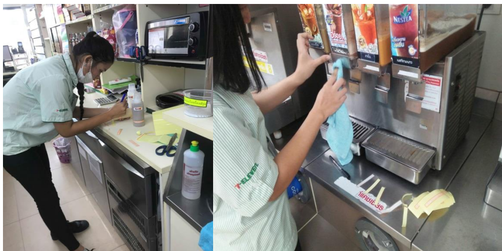
ติดบ่งชี้ถาวรที่อุปกรณ์

ขั้นตอนที่4 หลังจากวางแผนเรียบร้อยแล้วก็ดำเนินการตามขั้นตอนที่วางไว้