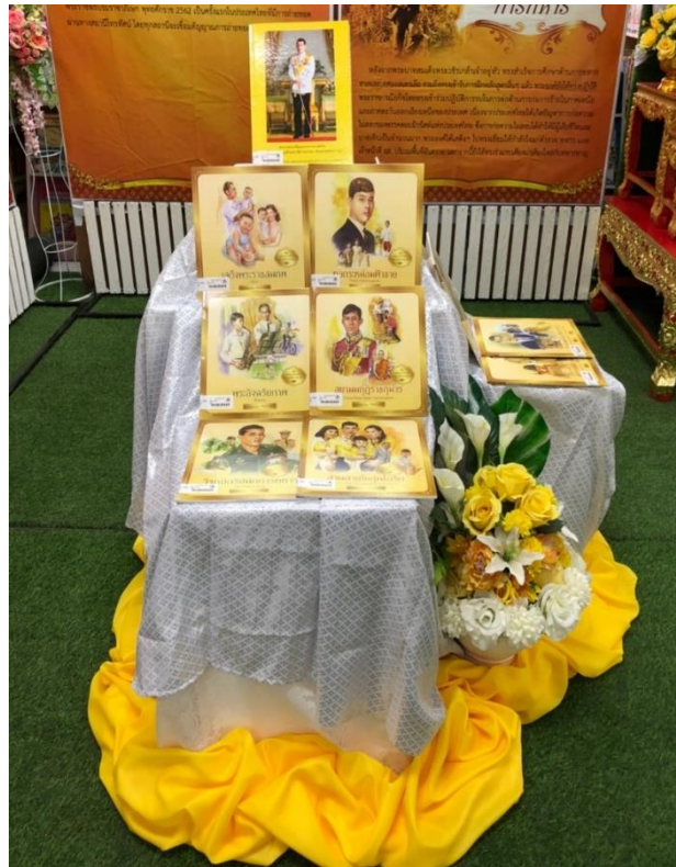
นิทรรศการ “เทิดไท้ องค์กษัตริย์ รัชกาลที่ 10”