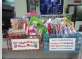
กิจกรรมส่งเสริมนิสัย รักการอ่าน