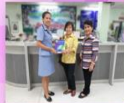
“การให้บริการแก่ชุมชน” โดยมีชุมชนมาร่วมบริจาคหนังสือเพื่อการส่งเสริมการอ่าน