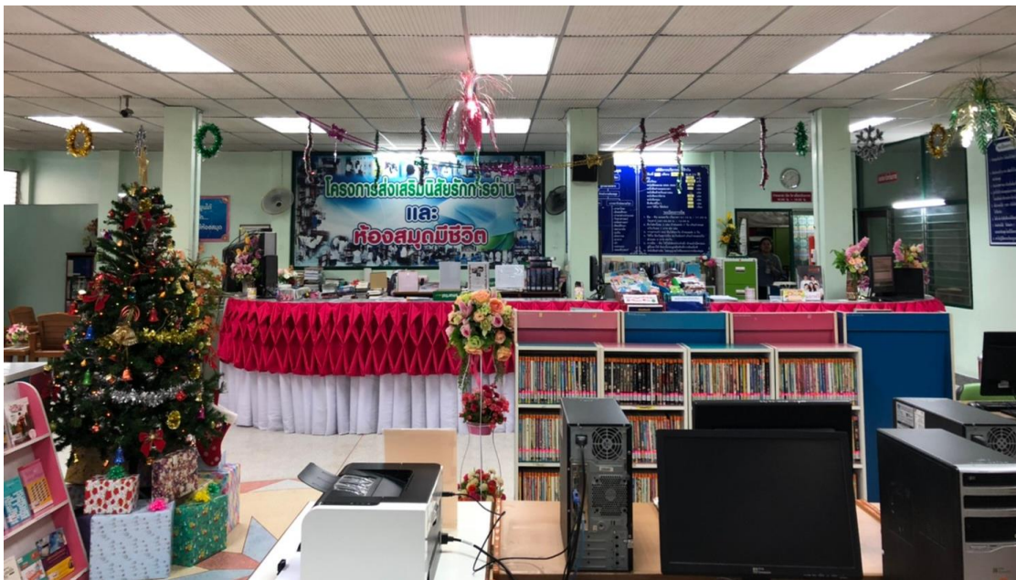
กิจกรรมวันคริสต์มาส