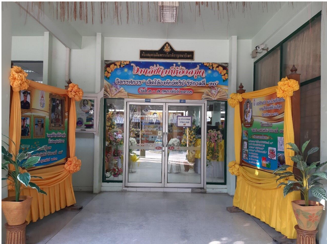
นิทรรศการ “เทิดไถ่ องค์กษัตริย์ รัชกาลที่ 10”