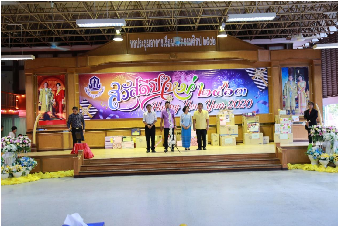
กินเลี้ยงวันปีใหม่ 2563