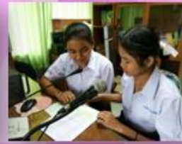
ห้องสมุดตามสาย