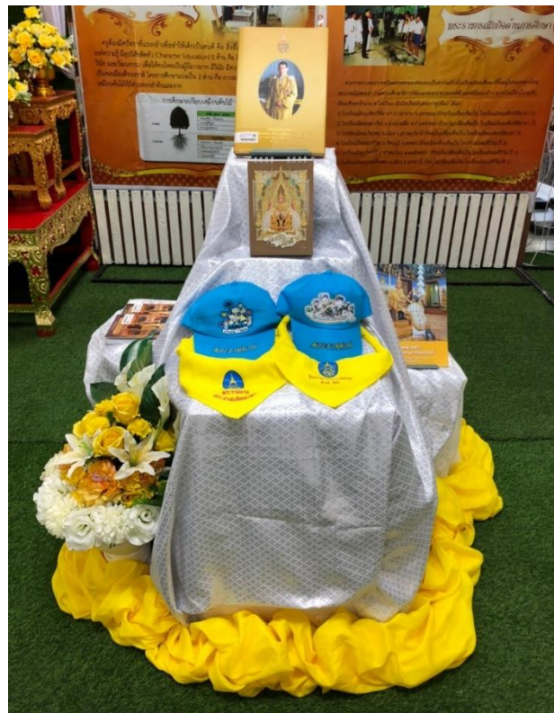
นิทรรศการ “เทิดไท้ องค์กษัตริย์ รัชกาลที่ 10”