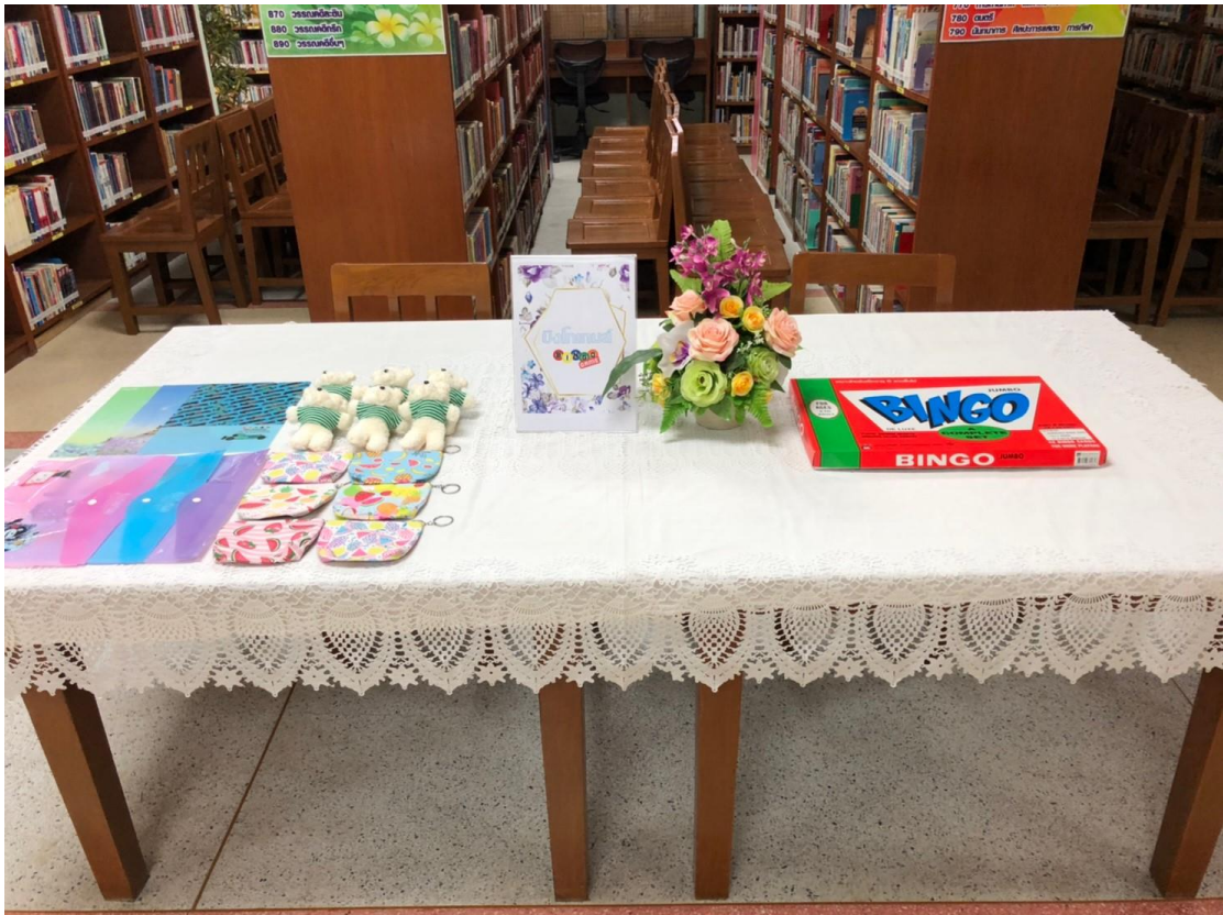
กิจกรรม “บิงโกเกม”