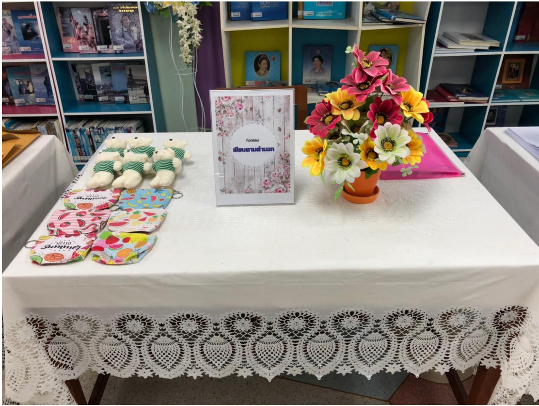
กิจกรรม “เขียนตามคำบอก”