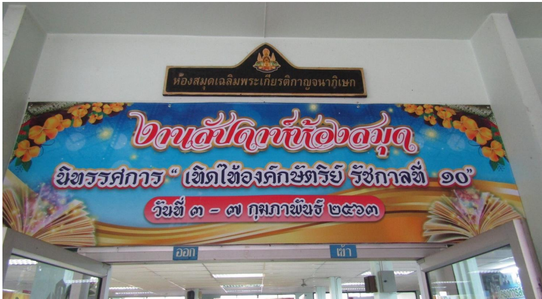
นิทรรศการ “เทิดไท้ องค์กษัตริย์ รัชกาลที่ 10”