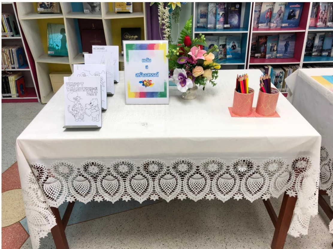
กิจกรรม “แต้มสีสร้างสรรค์”