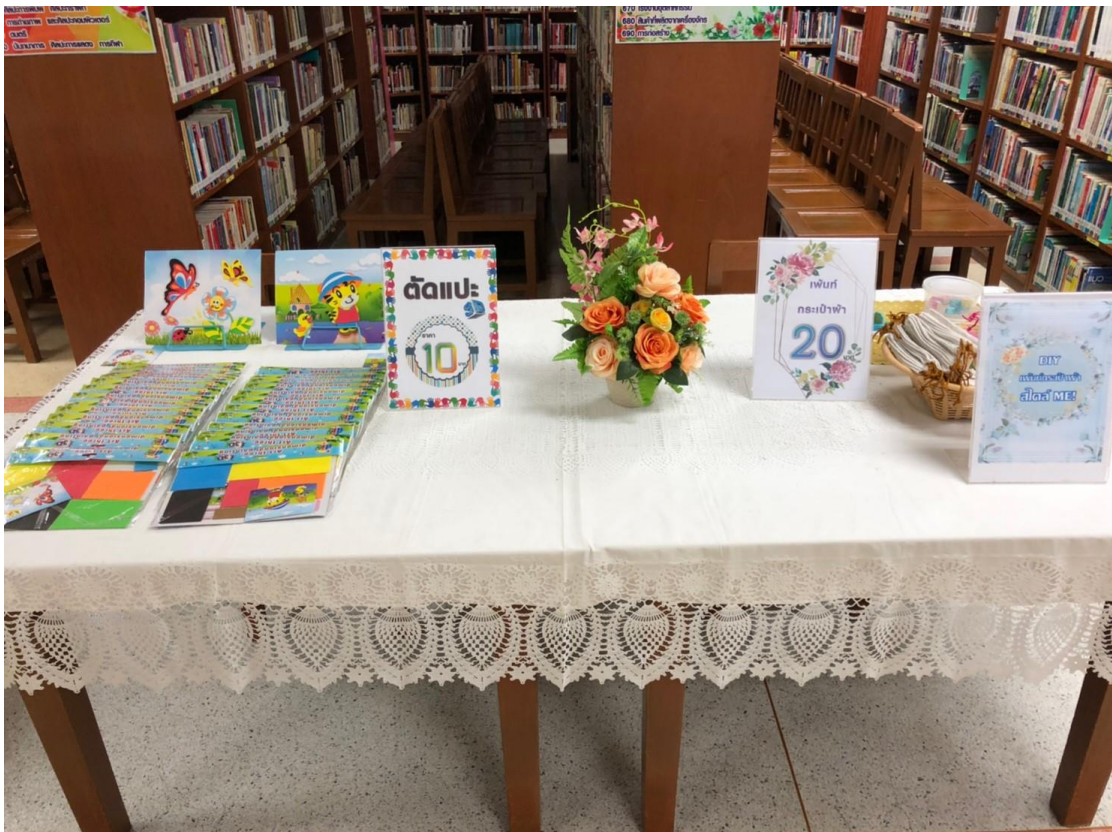
กิจกรรม “ตัดปะ 3D” และ กิจกรรม “DIY เย็บกระเป๋าใส่เหรียญ ME!!”