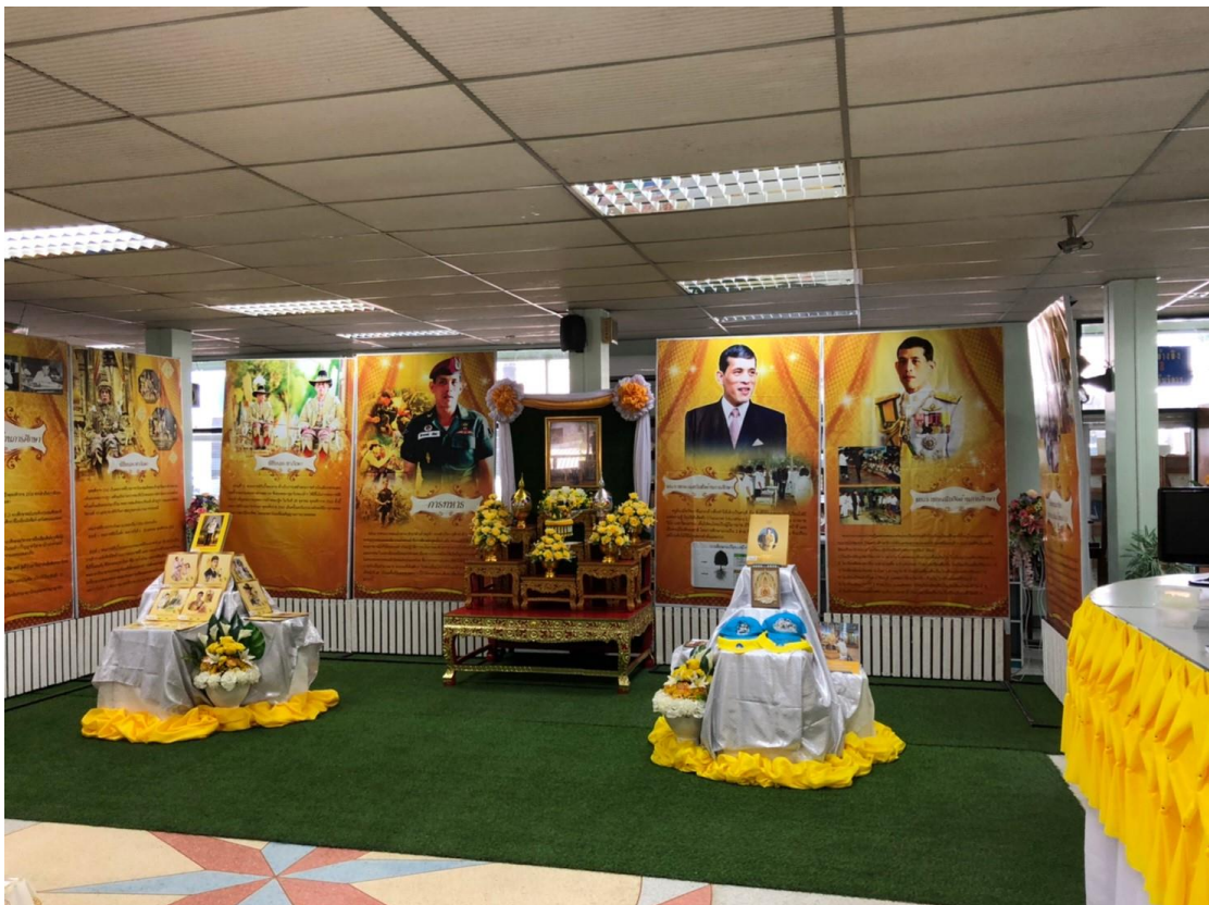
นิทรรศการ “เทิดไท้ องค์กษัตริย์ รัชกาลที่ 10”