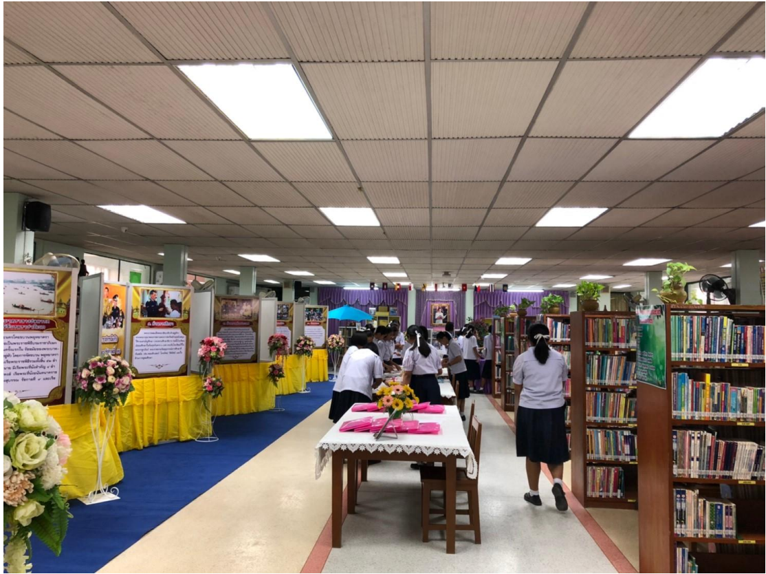
นิทรรศการ “เทิดไถ้ องค์กษัตริย์ รัชกาลที่ 10”