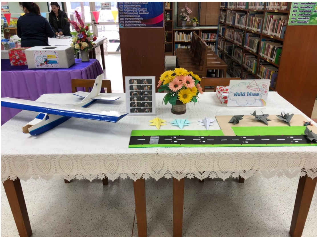
กิจกรรม “พับได้ให้เลย”