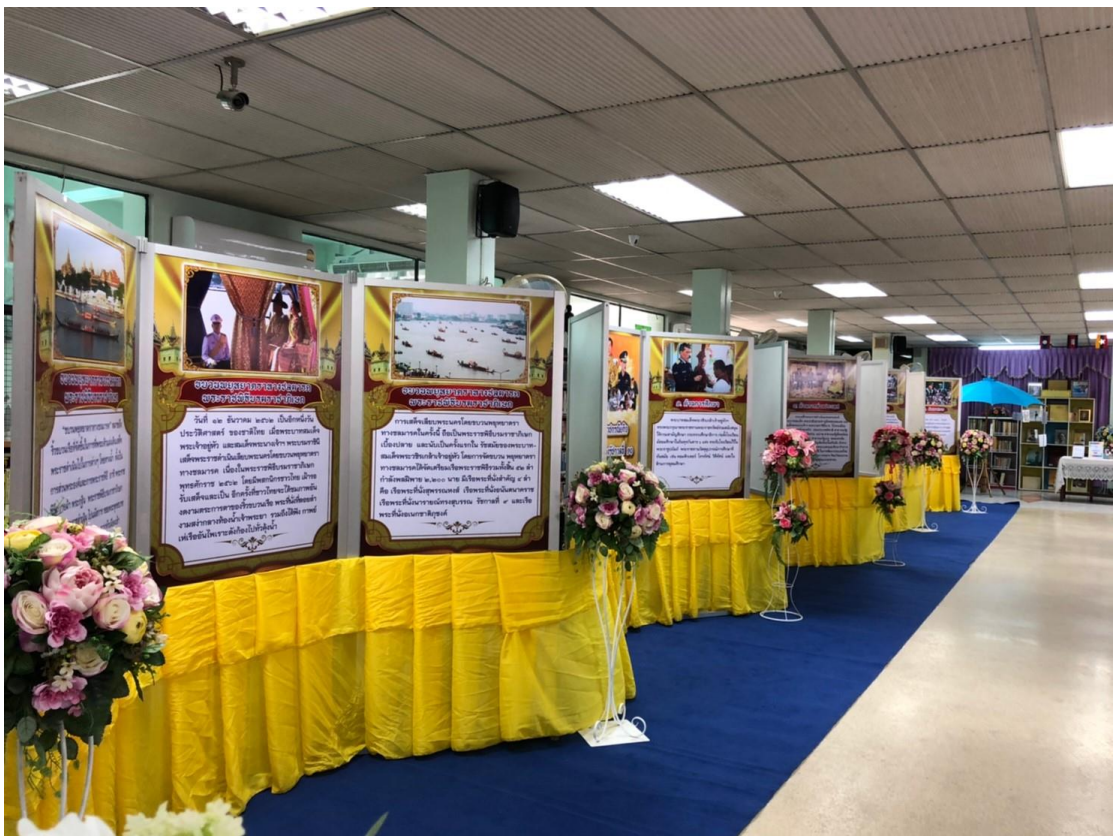
นิทรรศการ “เทิดไถ้ องค์กษัตริย์ รัชกาลที่ 10”