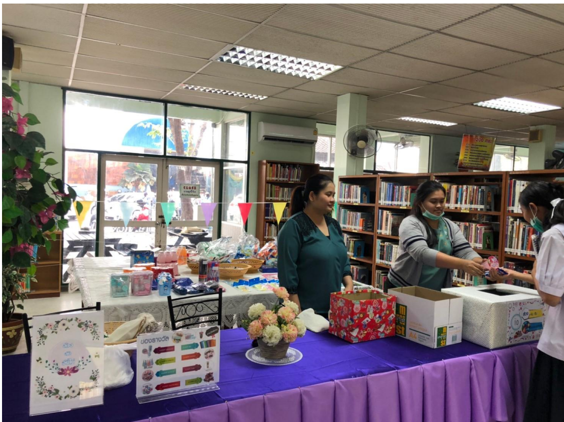
กิจกรรม “ล้วง ลับ จับ ไข่”