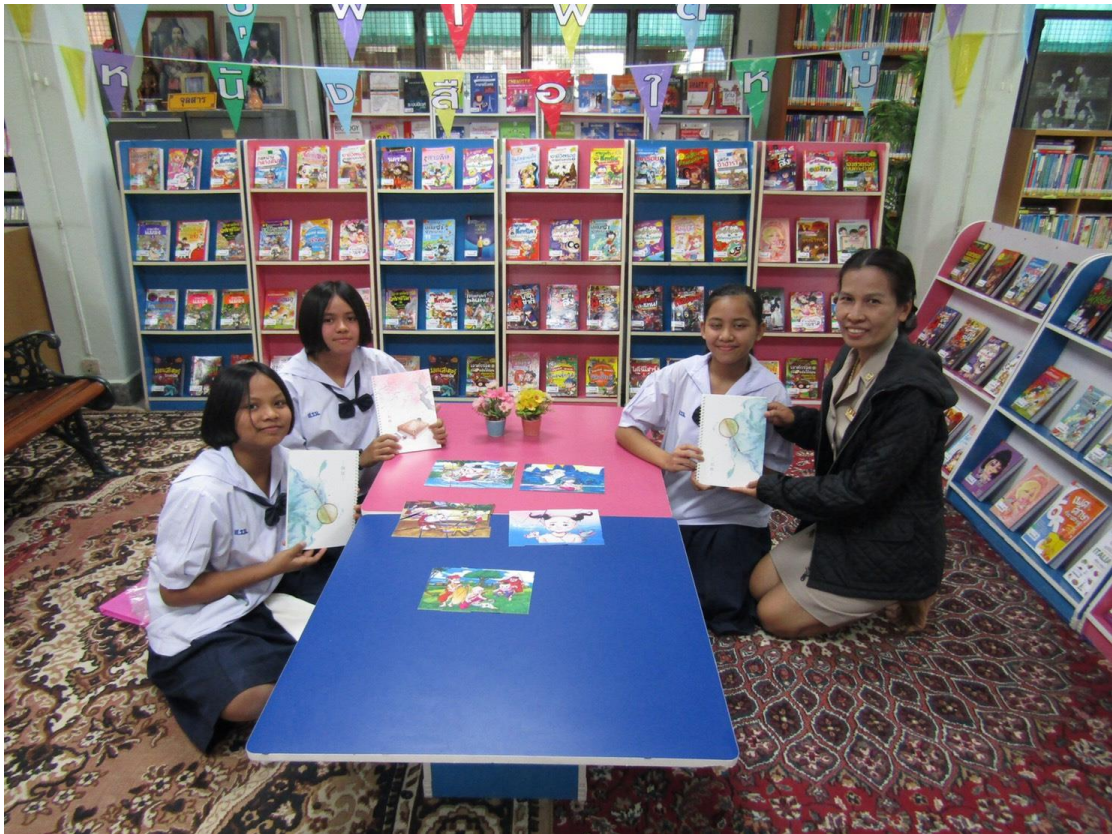
มุม “บุฟเฟต์หนังสือใหม่”