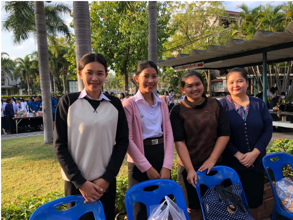
ตักบาตรวันขึ้นปีใหม่ 2563