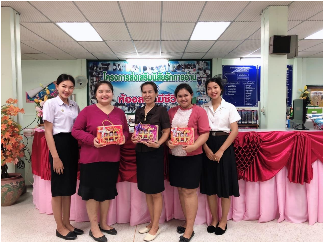
อาจารย์มานิเทศนักศึกษา ครั้งที่ 2 วันที่ 27 กุมภาพันธ์ 2563