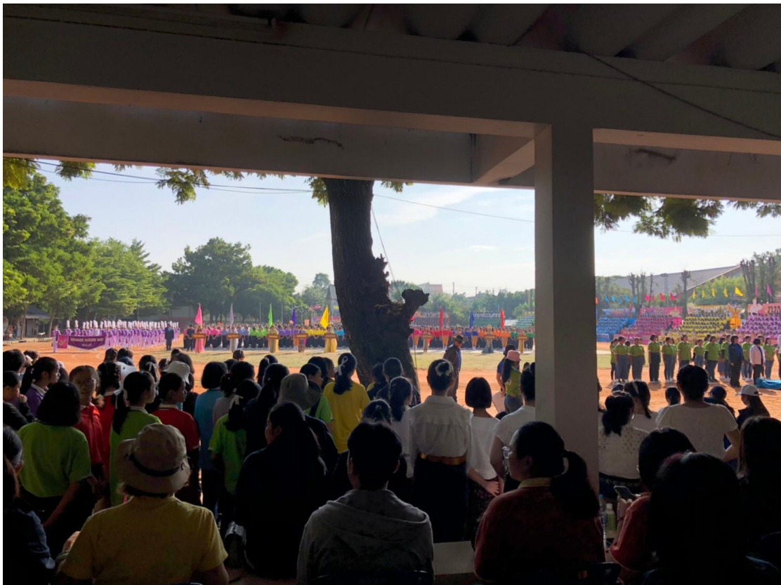
กีฬาสีกายใน