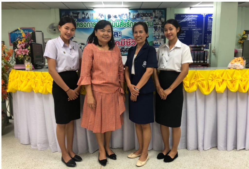
อาจารย์มานิเทศนักศึกษา ครั้งที่ 1 วันที่ 23 มกราคม 2563