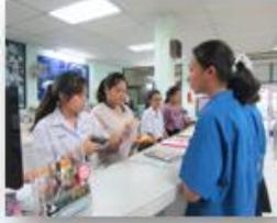
บริการยืม - คืน