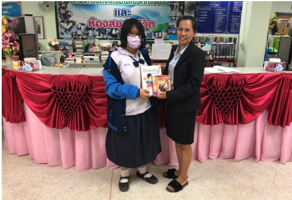
นักเรียนบริจาคหนังสือให้กับห้องสมุด