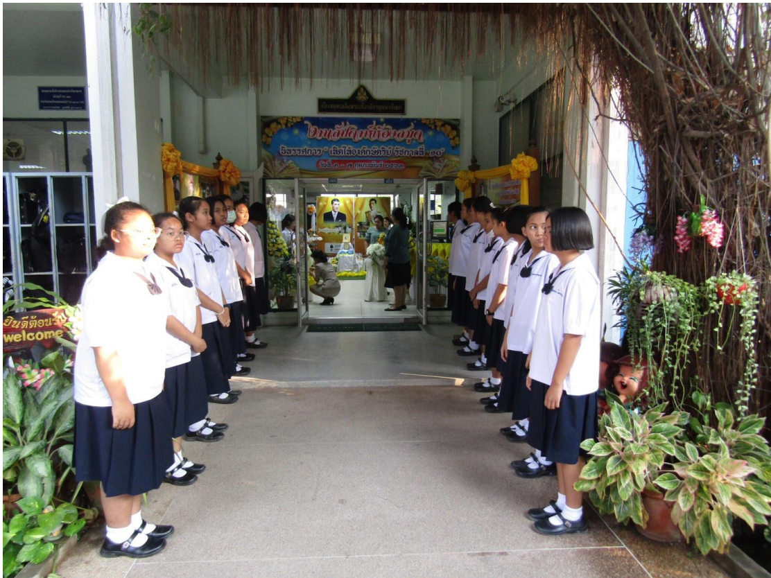
นิทรรศการ “เทิดไถ่ องค์กษัตริย์ รัชกาลที่ 10”