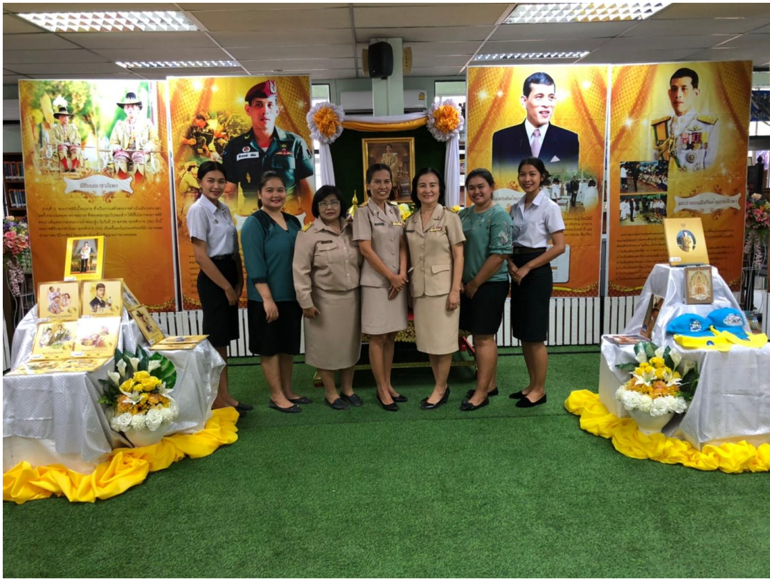
นิทรรศการ “เทิดไท้ องค์กษัตริย์ รัชกาลที่ 10”