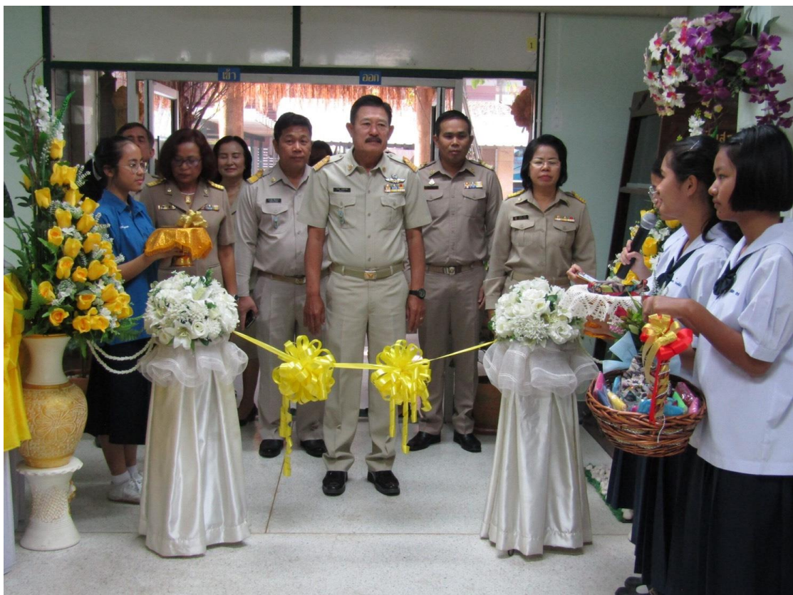
นิทรรศการ “เทิดไท้ องค์กษัตริย์ รัชกาลที่ 10”