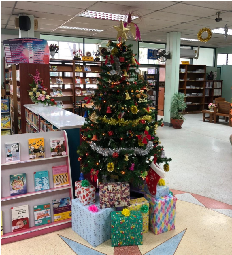
กิจกรรมวันคริสต์มาส