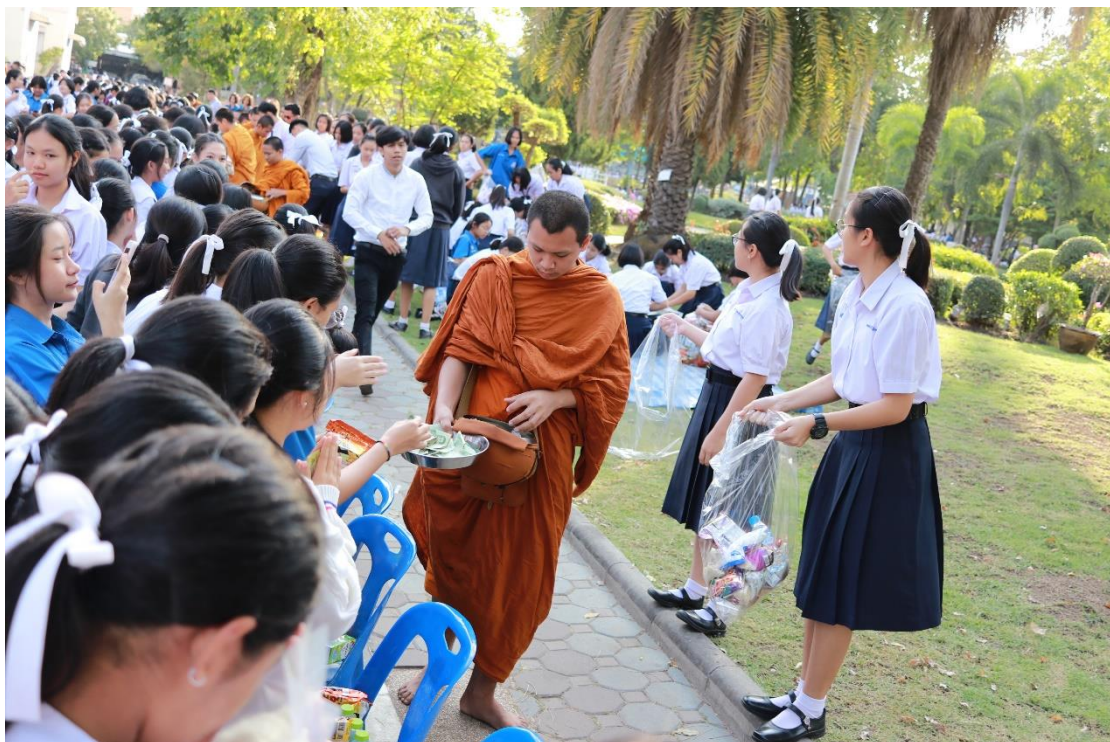
ตักบาตรวันขึ้นปีใหม่ 2563