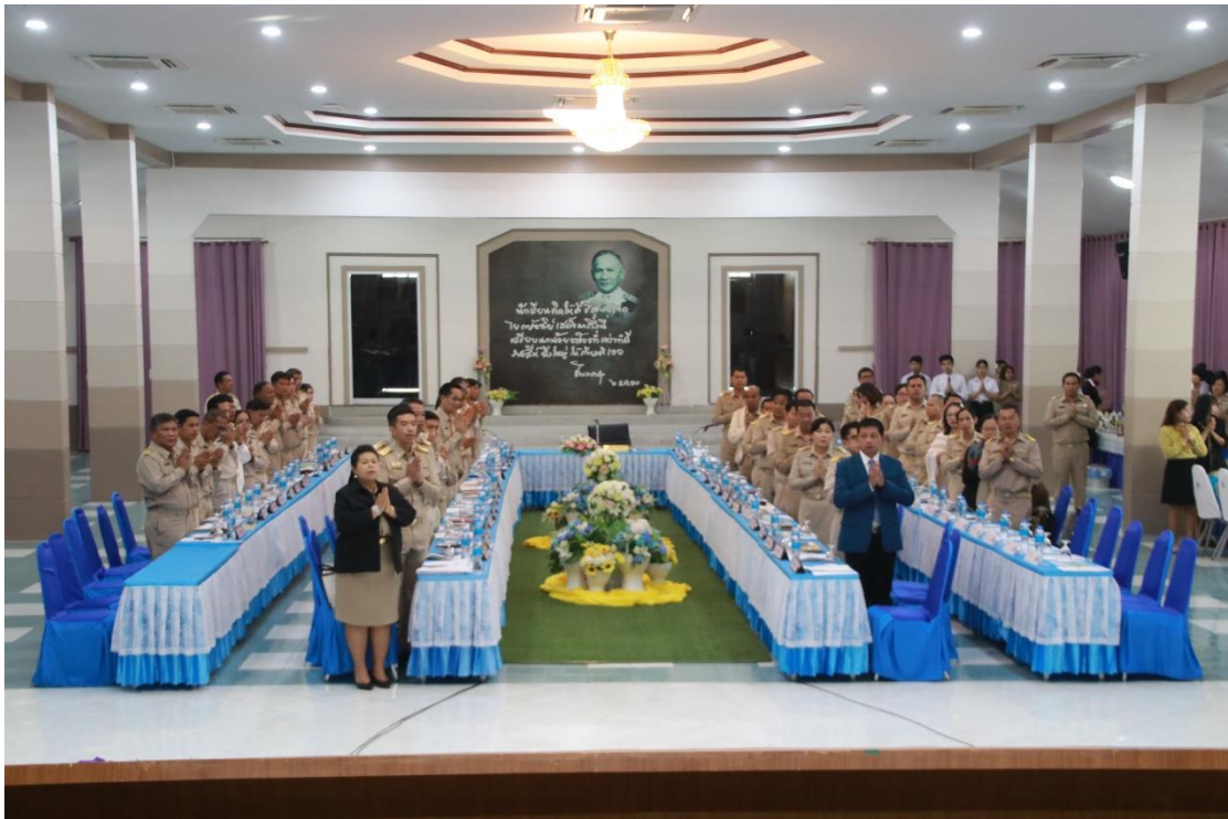
ช่วยรับรองการประชุมผู้อำนวยการโรงเรียน ในสังกัดสำนักงานเขตพื้นที่ มัธยมศึกษา เขต 31