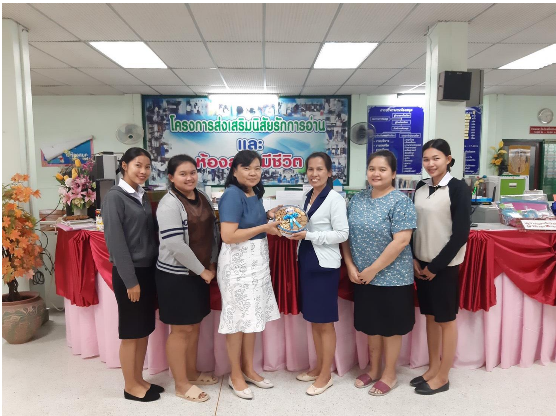
อาจารย์มานิเทศนักศึกษา ครั้งที่ 2 วันที่ 27 กุมภาพันธ์ 2563