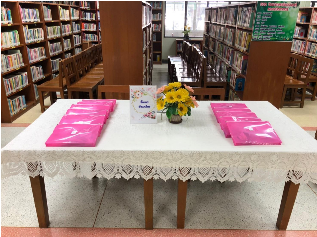
กิจกรรม “จิ๊กซอสำนวนไทย”