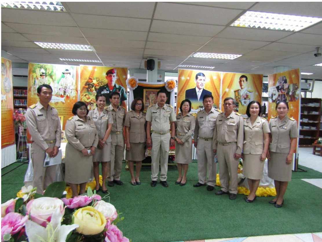
นิทรรศการ “เทิดไถ่ องค์กษัตริย์ รัชกาลที่ 10”