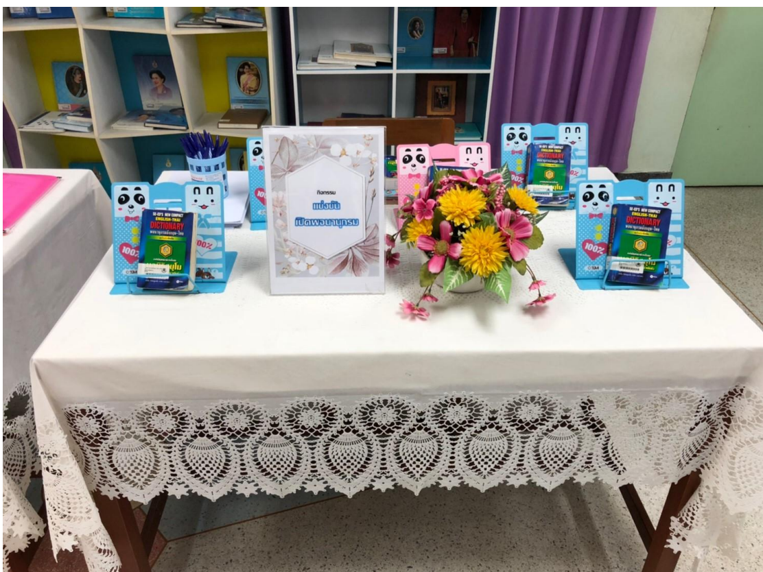
กิจกรรม “แข่งขันเปิดพจนานุกรม”