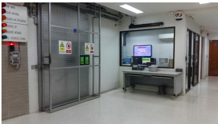
ภาพที่ ก.1 บริเวณห้องควบคุมเครื่องฉายรังสีแกมมา