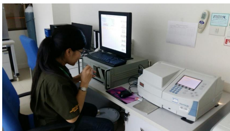
ภาพที่ ก.3 วัดปริมาณรังสีแกมมา