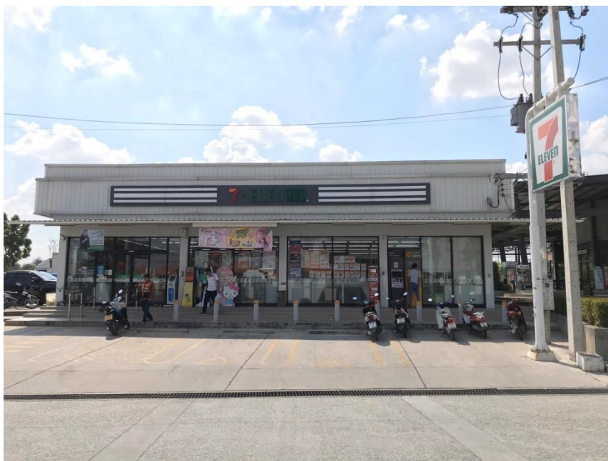
ภาพที่1 ภาพหน้าร้าน

หากพนักงานสื่อสารกับลูกค้าเข้าใจก็จะทำให้สถานประกอบการนั้นเสียโอกาสในการขายสินค้า ผู้ศึกษาจึงมีแนวคิดจัดทำป้ายสื่อภาษาเพื่อบอกหมวดหมู่และลดปัญหาการสื่อสารกับลูกค้าที่ไม่เข้าใจ นอกจากนี้ยังทำให้ลูกค้าหาสินค้าได้อย่างสะดวกและรวดเร็วยิ่งขึ้น