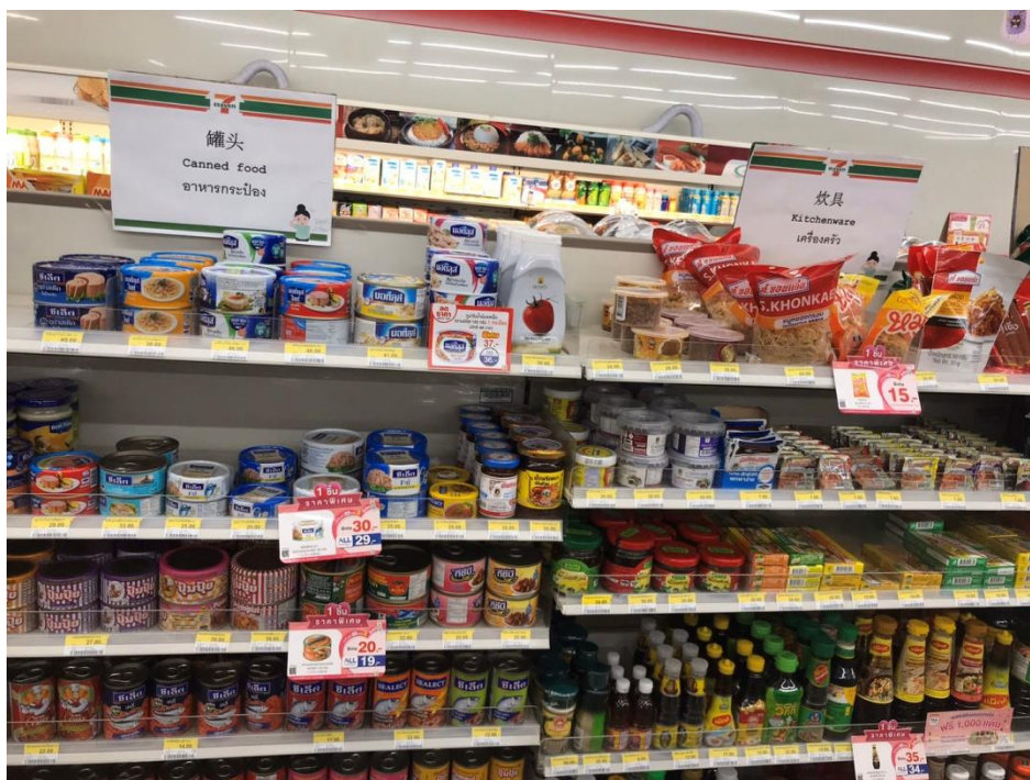
ภาพที่ 6 ภาคผนวก