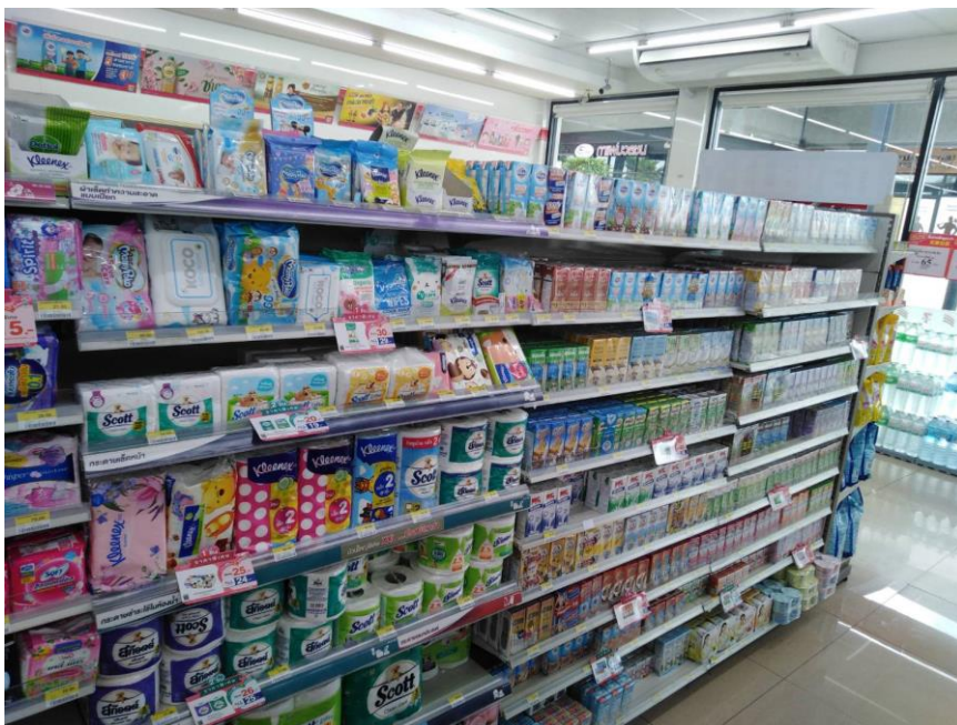
ภาพที่2 ก่อนติดป้ายสื่อภาษา