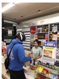
ภาพที่ 2 สังเกตปัญหาจากการทำงาน