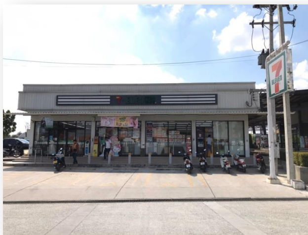
ภาพที่ 1 แสดงแผนที่ / ที่ตั้ง

เลขที่233/ 35 หมู่ 3 ตำบล บ่อวิน อำเภอ ศรีราชา จังหวัดชลบุรี 20230