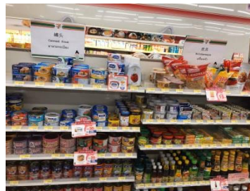
ภาพที่ 4 จัดทำป้ายสื่อสาร