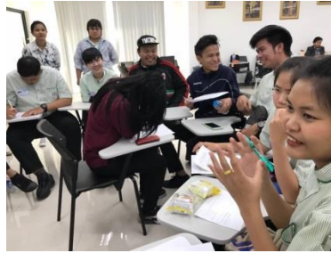
ภาพที่ 3 เสนอปัญหาและปรึกษาเรื่องการจัดทำป้ายสื่อสารภาษา