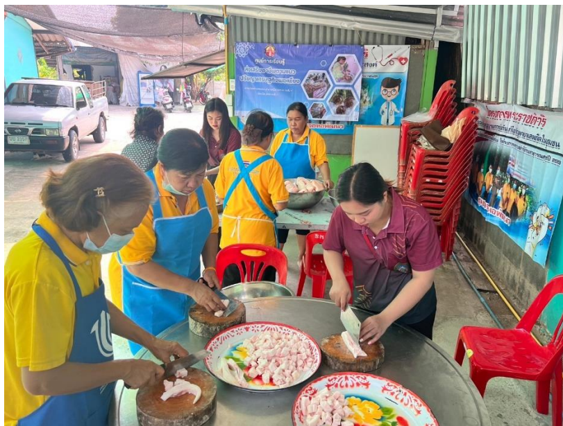
ภาพที่ 1 ผู้เข้าร่วมกิจกรรมจัดเตรียมวัตถุดิบ เพื่อทำน้ำพริกจากหมู