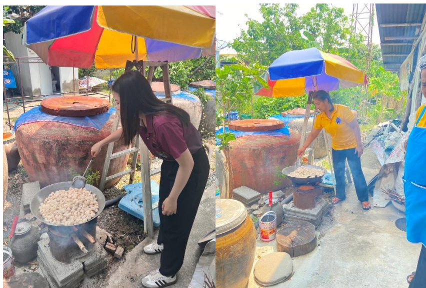
ภาพที่ 2 เจียวกากหมู เจียวหอม กระเทียม ใบมะกรูด