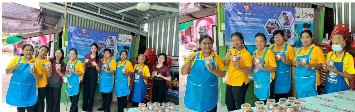
ภาพที่ 6 สิ้นสุดกิจกรรมทำน้ำพริกกากหมู