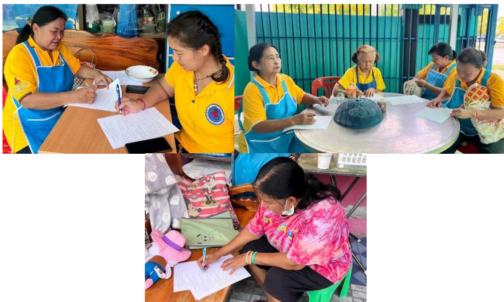
ภาพที่ 9 ประเมินความพึงพอใจของผู้เข้าร่วมโครงการ