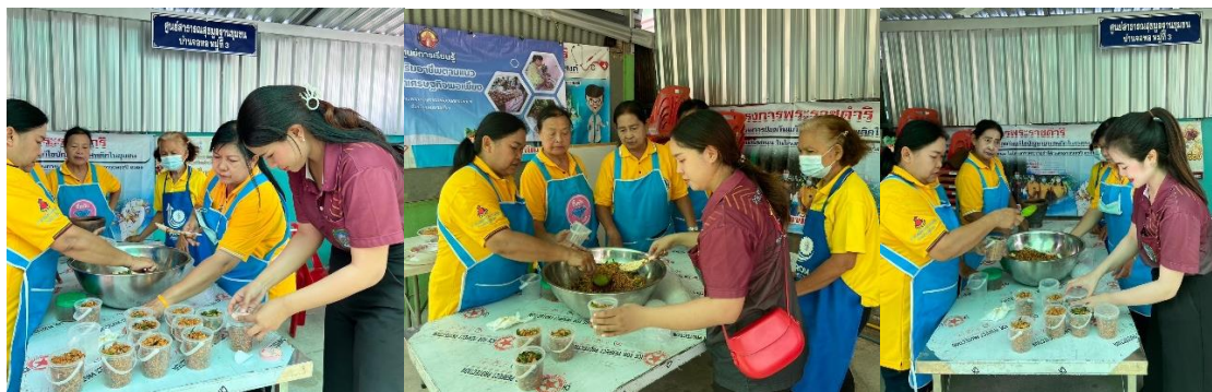
ภาพที่ 4 บรรจุน้ำพริกกากหมูใส่อุปกรณ์ที่จัดเตรียมไว้