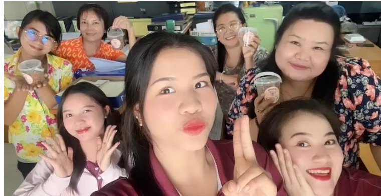
ภาพที่ 10 หลังจากที่มีการโพสต์ขายทางเพจได้มีคนสั่งซื้อจำนวน 10 กระปุก ส่งที่สำนักงานเทศบาล ตำบลจอหอ