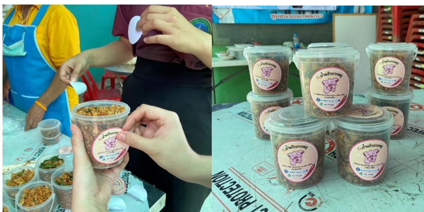
ภาพที่ 5 ติดสติ๊กเกอร์ตราภัณฑ์