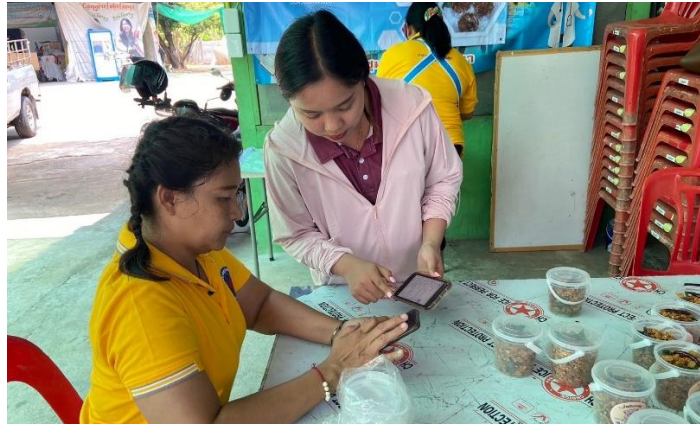
ภาพที่ 7 แนะนำและให้ความรู้เกี่ยวกับการดูแลเพจและการเคลื่อนไหวเพจตลอดเวลาให้การขายออนไลน์มีประสิทธิภาพยิ่งขึ้น