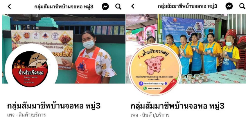
ภาพที่ 8 ก่อน / หลัง การเคลื่อนไหวเพจ